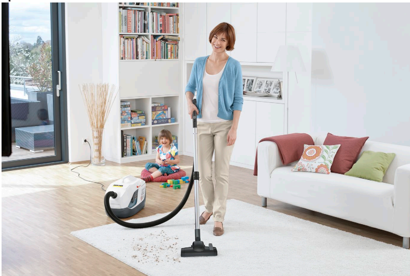
DS 6 Premium Mediclean