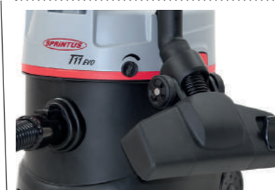
Крепление для дополнительных аксессуаров.