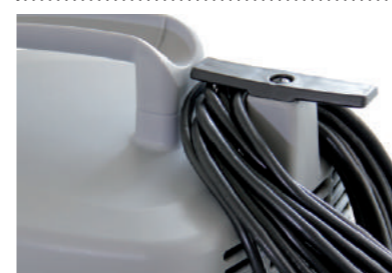
Место для хранения шнура с фиксацией.