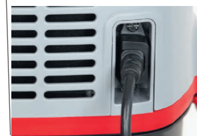
new Комфортность: подключаемый шнур питания длиной 10 м.