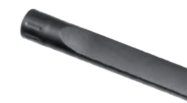
Щелевая насадка 230 мм Арт. № 101.023