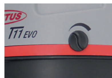
Регулировка мощности всасывания