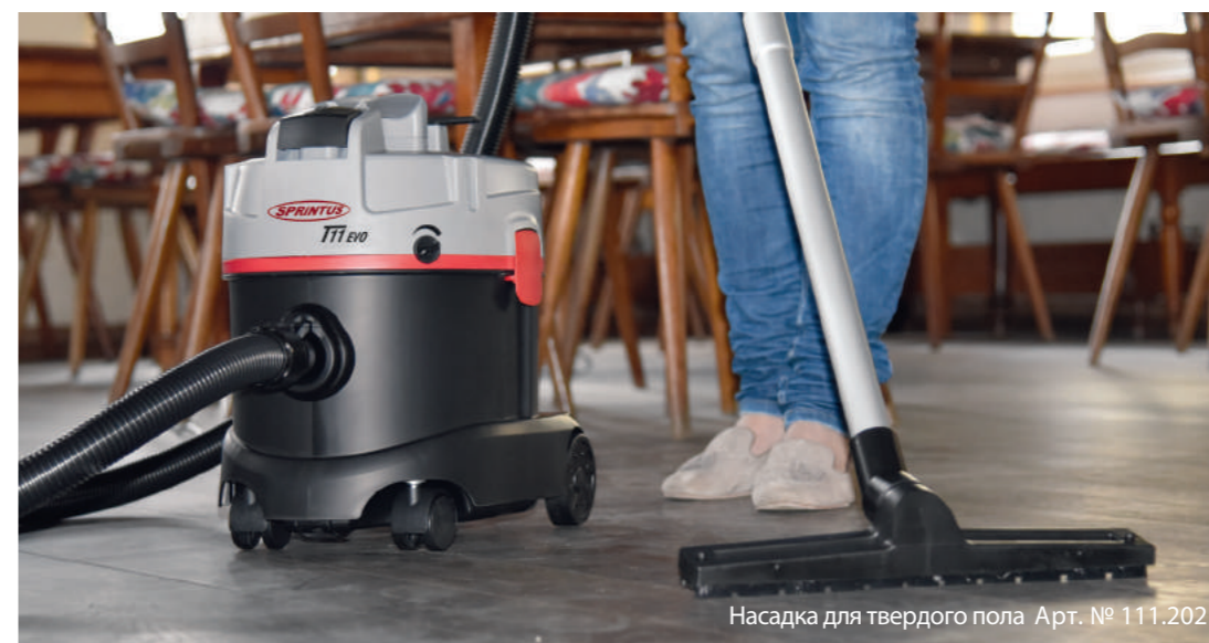
Насадка для твердого пола Арт. № 111.202