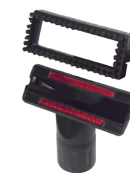
Мебельная насадка Арт. № 106.028