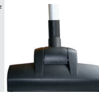
Турбо-щетка 284 мм Арт. № 106.012