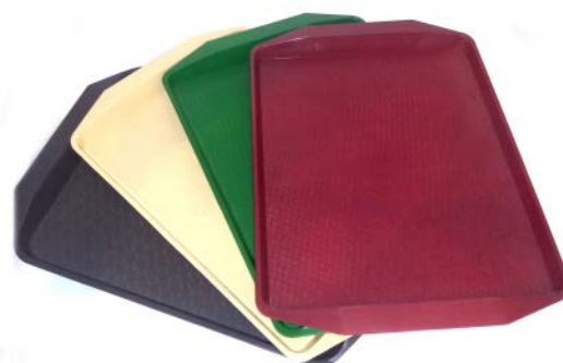
Поднос 1732-106 42x30 см, бежевый