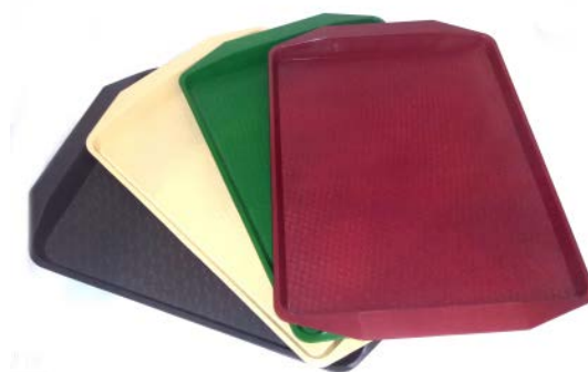
Поднос 1732-106 42x30 см, бежевый