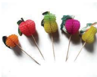
Пика «Фрукты» FS-10