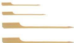
Пика для канапе «Гольф» BFS-9