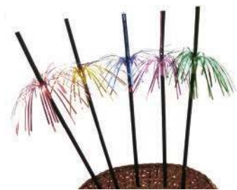
Соломинка для коктейлей CS-1 «пальма»