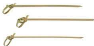
Пика для канапе «Узелок» BKS-10