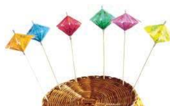
Пика «Зонтик» US-15