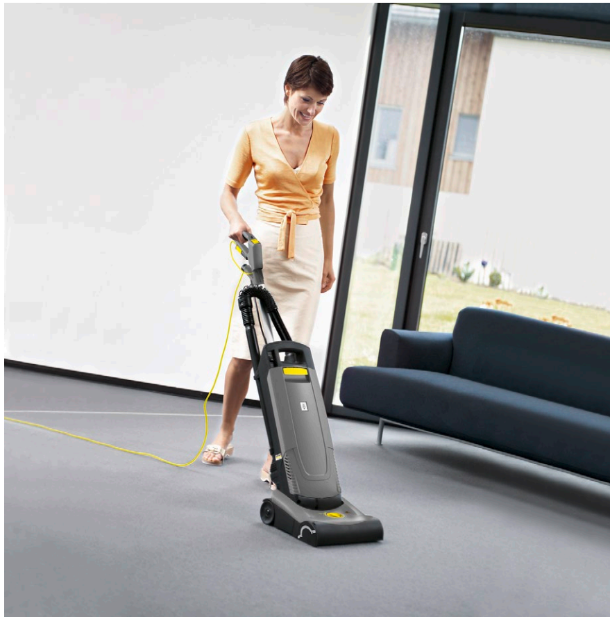
Пылесос CV 30/1