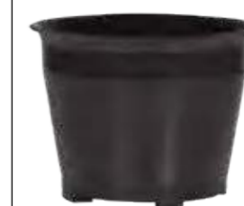
Устройство "Циклон", Арт. № 116.115

Из-за формы впускного патрубка, образующийся туман направляется к внутренней стенке бака. Больше нет необходимости в дополнительных фильтрах. Система работает даже при образовании плотной пены. Расположенные сбоку воздухозаборники охлаждения обеспечивают постоянное разделение охлаждающего и обрабатываемого воздуха.