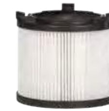
Фильтр HEPA 13, Арт. № 116.106