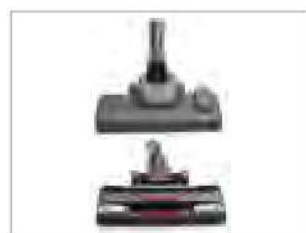
НОВАЯ МОЩНАЯ НАСАДКА ДЛЯ ВЫСОКОЭФФЕКТИВНОЙ УБОРКИ