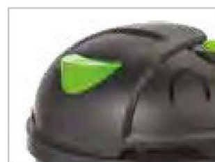
КНОПКА ВКЛЮЧЕНИЯ/ВЫКЛЮЧЕНИЯ УПРАВЛЯЕТСЯ НОГОЙ ОПЕРАТОРА