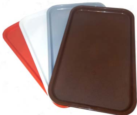
Поднос 1737-106 53x33 см, бежевый