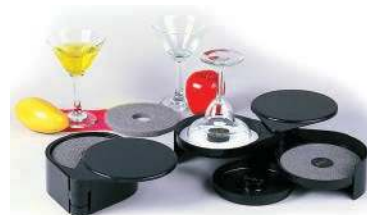
Риммер RM-3 Тройной, пластмасса 200x160x70 мм