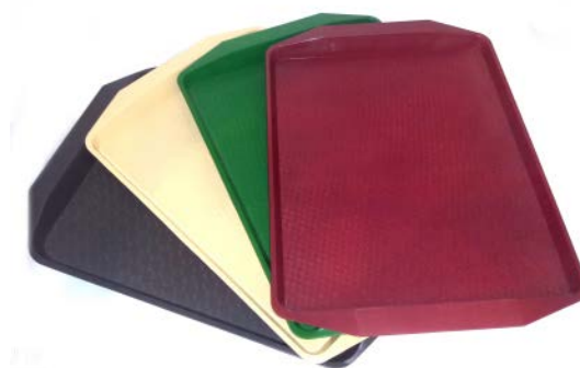
Поднос 1732-106 42x30 см, бежевый