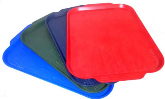
Поднос 1730-106 45x35,5 см, бежевый