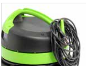
GANCHO PARA CABLE