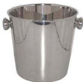
Ведро для шам- панского BS-III-D 3,8 л, нерж.сталь