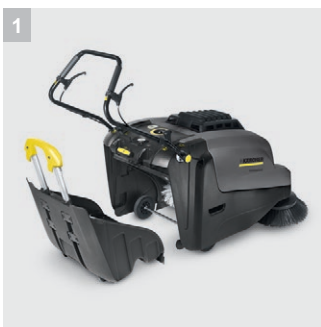
1 Контейнер для мусора

"Что может быть легче, чем подметать" Ручная подметальная машина с питанием от батареи и электронноуправляемой подзарядкой. Отсутствие выхлопных газов, низкий уровень шума, используется для тщательной, без пыли очистки площадей от 600 кв.м., идеально подходит для использования внутри помещения. Подходит для чистки ковров с дополнительным комплектом для чистки ковров. Проста в использовании благодаря концепции управления EASY и мобильному контейнеру для мусора с троллейной системой. Компактные размеры для легкого маневрирования.