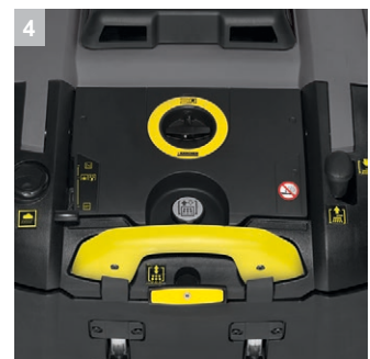
4 Концепция EASY Operation