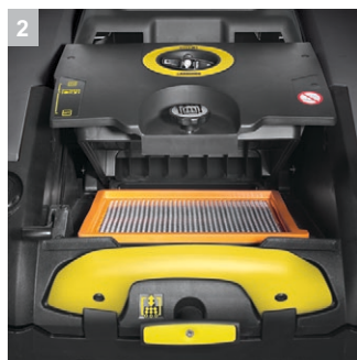
2 Эффективная система очистки фильтра с механическим управлением