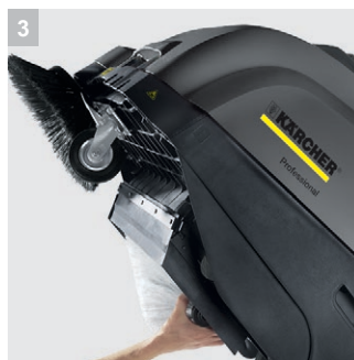
3 Простота обслуживания